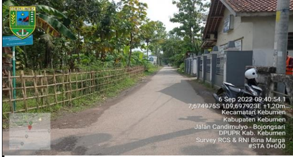
FOTO SURVEY KONDISI JALAN TAHUN 2022

Jl. HM. Sarbini No. 37 Kebumen Telp. 0287-381128 Fax. 0287-382821