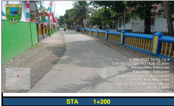
FOTO SURVEY KONDISI JALAN TAHUN 2022

Jl. HM. Sarbini No. 37 Kebumen Telp. 0287-381128 Fax. 0287-382821