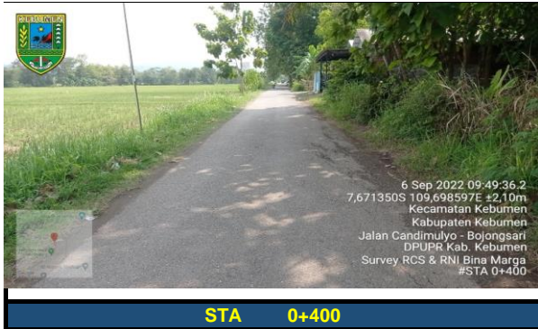
FOTO SURVEY KONDISI JALAN TAHUN 2022

Jl. HM. Sarbini No. 37 Kebumen Telp. 0287-381128 Fax. 0287-382821