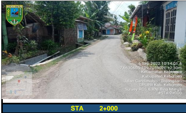
FOTO SURVEY KONDISI JALAN TAHUN 2022

Jl. HM. Sarbini No. 37 Kebumen Telp. 0287-381128 Fax. 0287-382821