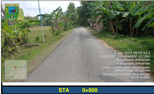
FOTO SURVEY KONDISI JALAN TAHUN 2022

Jl. HM. Sarbini No. 37 Kebumen Telp. 0287-381128 Fax. 0287-382821