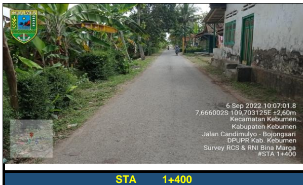
FOTO SURVEY KONDISI JALAN TAHUN 2022

Jl. HM. Sarbini No. 37 Kebumen Telp. 0287-381128 Fax. 0287-382821