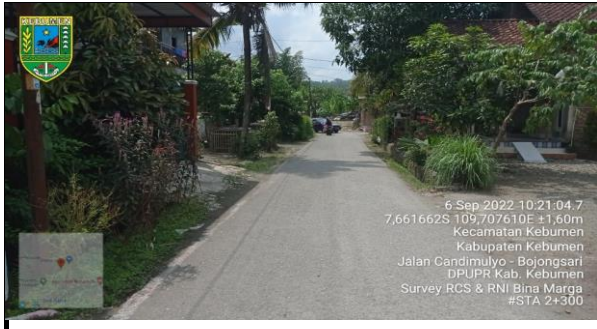
FOTO SURVEY KONDISI JALAN TAHUN 2022

Jl. HM. Sarbini No. 37 Kebumen Telp. 0287-381128 Fax. 0287-382821