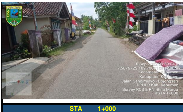
FOTO SURVEY KONDISI JALAN TAHUN 2022

Jl. HM. Sarbini No. 37 Kebumen Telp. 0287-381128 Fax. 0287-382821