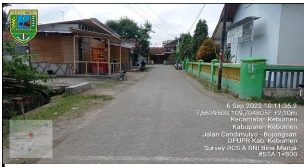
FOTO SURVEY KONDISI JALAN TAHUN 2022

Jl. HM. Sarbini No. 37 Kebumen Telp. 0287-381128 Fax. 0287-382821