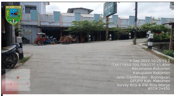
FOTO SURVEY KONDISI JALAN TAHUN 2022

Jl. HM. Sarbini No. 37 Kebumen Telp. 0287-381128 Fax. 0287-382821