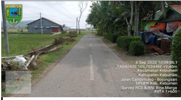
FOTO SURVEY KONDISI JALAN TAHUN 2022

Jl. HM. Sarbini No. 37 Kebumen Telp. 0287-381128 Fax. 0287-382821