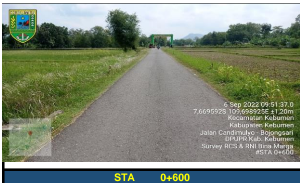
FOTO SURVEY KONDISI JALAN TAHUN 2022

Jl. HM. Sarbini No. 37 Kebumen Telp. 0287-381128 Fax. 0287-382821