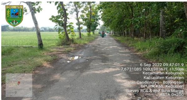
FOTO SURVEY KONDISI JALAN TAHUN 2022

Jl. HM. Sarbini No. 37 Kebumen Telp. 0287-381128 Fax. 0287-382821